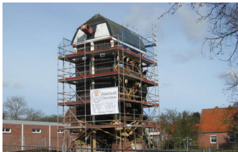
Demontage der kompletten Mühle im März 2010