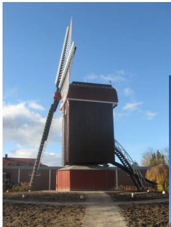
Das Ergebnis nach etwa 8-monatiger Sanierungsarbeit