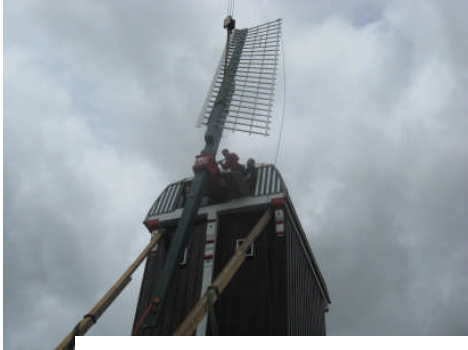
Anbringen der Mühlenflügel im September 2010