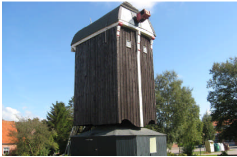
Bockwindmühle Dornum von 1626 vor Sanierungsbeginn

Für das leibliche Wohl sorgen u. a. die Landfrauen Dornum