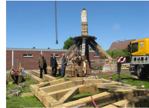
Wiederaufbau ab Mai 2010