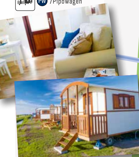
Einfach urig, unsere Pipowagen!